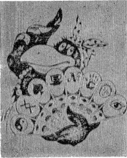
(Продолжение. Начало в №№ 14, 26, 42)