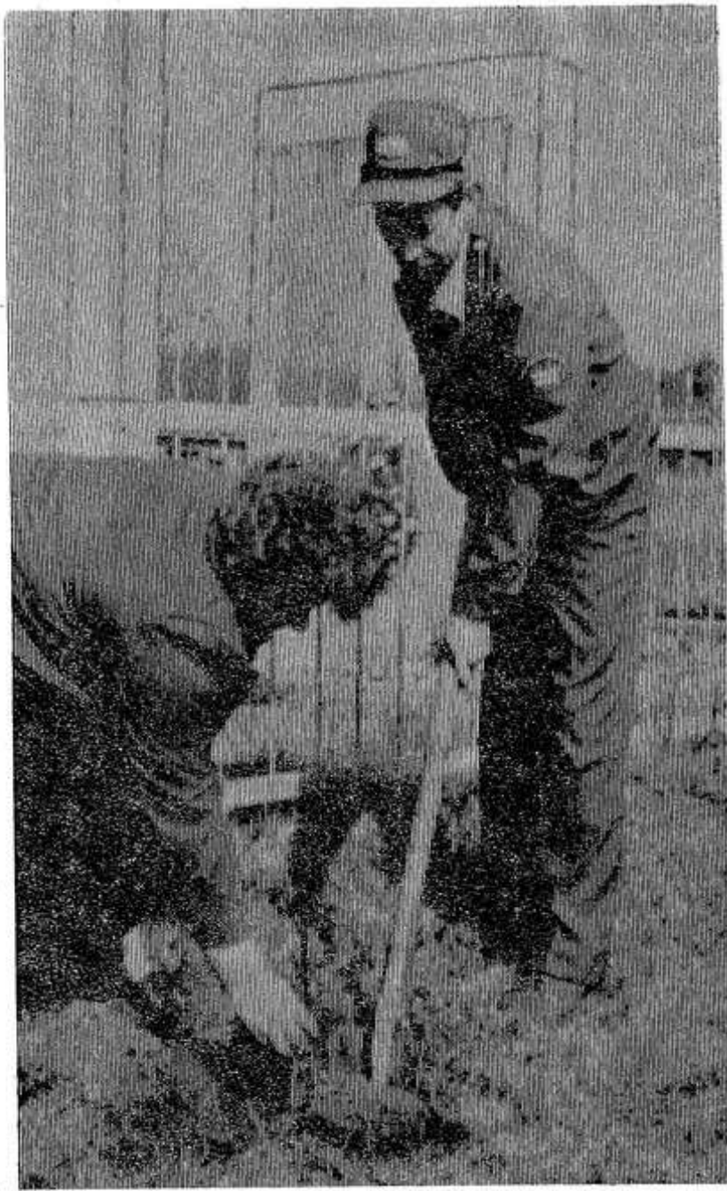
Военная судьба деревни Артюхово Норкинской волости схожа с печально известным селом Ха-

тынь в Белоруссии. В сентябре 1942 года каратели там заживо сожгли 63 мирных жителя, о чем напоминает памятный обелиск, установленный на месте барака, куда фашисты согнали женщин, детей, стариков — всех, кто не ушел в лес в партизаны.