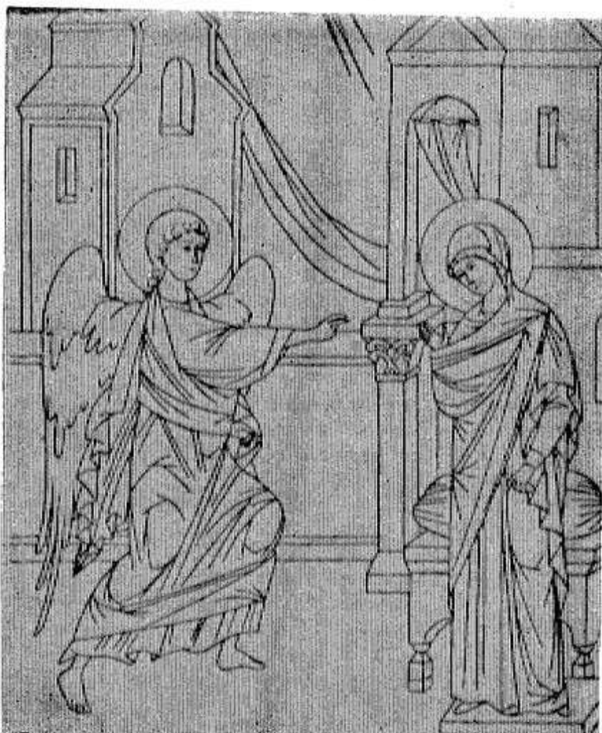
5 апреля, Великий пост. День ангела у Никона, Лидии, Василия.

6 апреля. Великий пост. День ангела у Захарии, день иконы Божией Матери, именуемой «Тучная гора». Предпразднество Благовещения Пресвятой Богородицы. Захарьев день. Вода на лугу — сено в стогу, лед весенний тонет или остается на берегу — к плохому лету. Если ночь на Захария тепла — весну жди дружную.