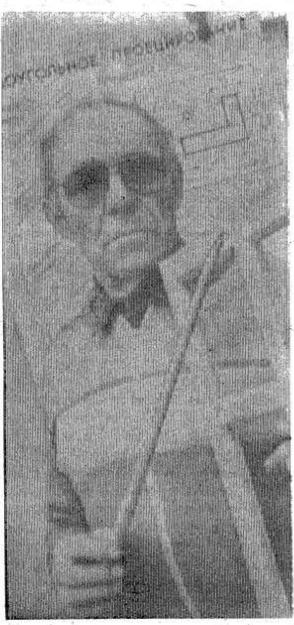
Все, кто посещал Макушинскую школу, непременно об