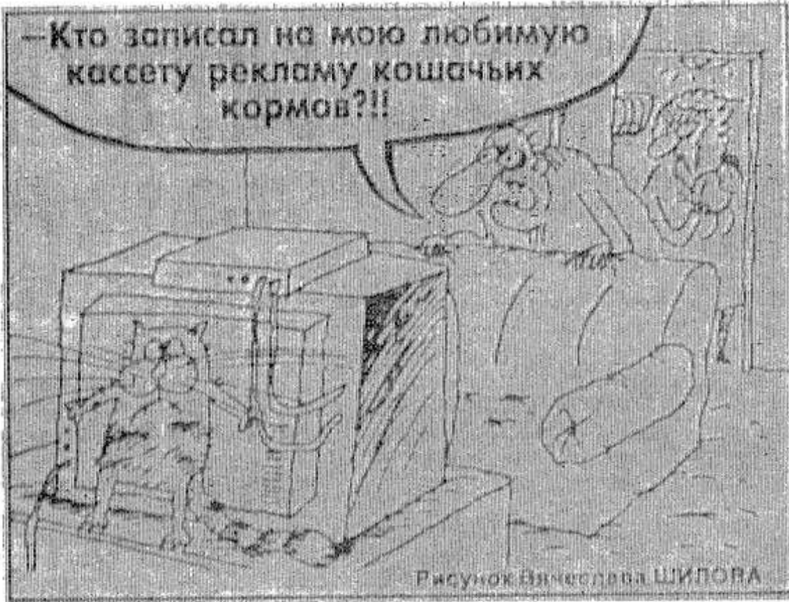
Рисунок Вячеслава ШИПОРА

К печати подготовлено по пресс-центром областного Собрания депутатов.