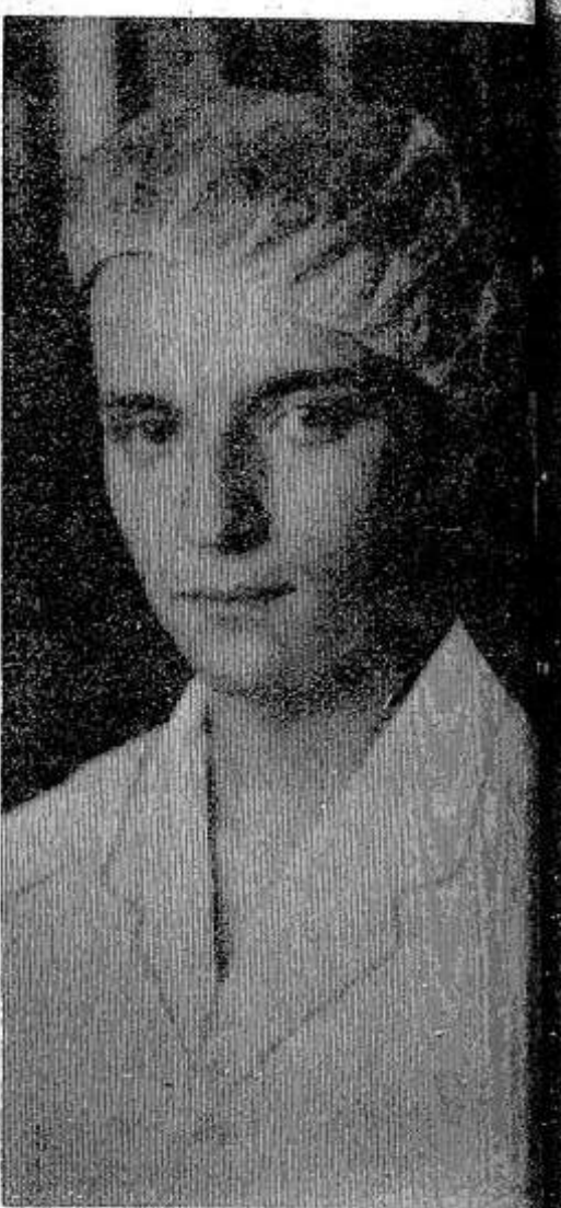
Основа любого производства — слаженный труд коллектива. Силен он не только старыми опытными работниками, но и молодыми, которые приобретают мастерство и умения, продолжают трудовые традиции.

показывал на дверь — вспомним случай Степашина, — про должны заявлять, что готовы идти с ним до конца? Теперь они все, на словах, в оппозиции к Ельцину; кто в правой, кто в центристской, кто вообще непонятно в какой.