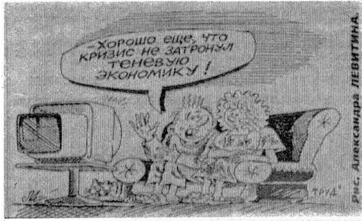
Рис. Александра ЛЕВИТИНА

Управление делами президента РФ намерено ежегодно приобретать 150—200 автомобилей марки «БМВ», производство которых начато на «Автоторе» в Калининграде. Об этом заявил управделами президента Павел Бородин. По его словам, покупать машины «БМВ» выгоднее, чем приобретать «Волги». П. Бородин заявил, что из 900 «Волг», покупаемых управлением ежегодно, «половину сразу ставим под забор, а вторую половину — чуть позже».