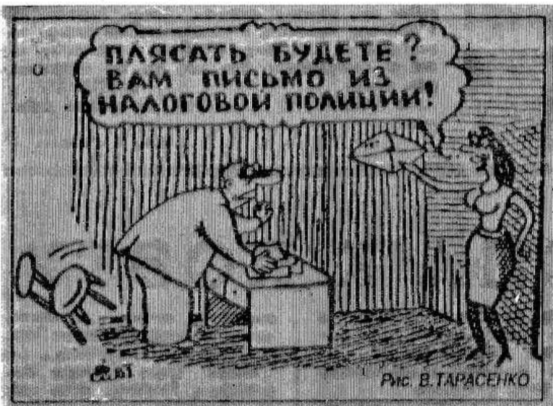
Рис. В. ТАРАСЕНКО

Государственная Дума перенесла рассмотрение вопроса об импичменте президенту Б. Ельцину на середину мая.