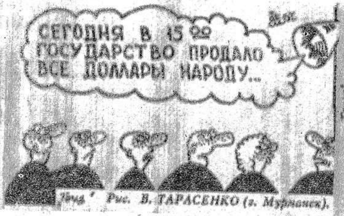
Рис. В. ТАРАСЕНКО (г. Мурманск).

Правительство РФ разрешило Пенсионному фонду в марте, апреле и мае 1999 г. привлекать на срок не более 6 месяцев кредит Сбербанка РФ на общую сумму до 10 миллиардов рублей. Об этом говорится в Постановлении «О дополнительных мерах, направленных на погашение задолженности по выплате государственных пенсий», подписанном премьер-министром Е. Примаковым.