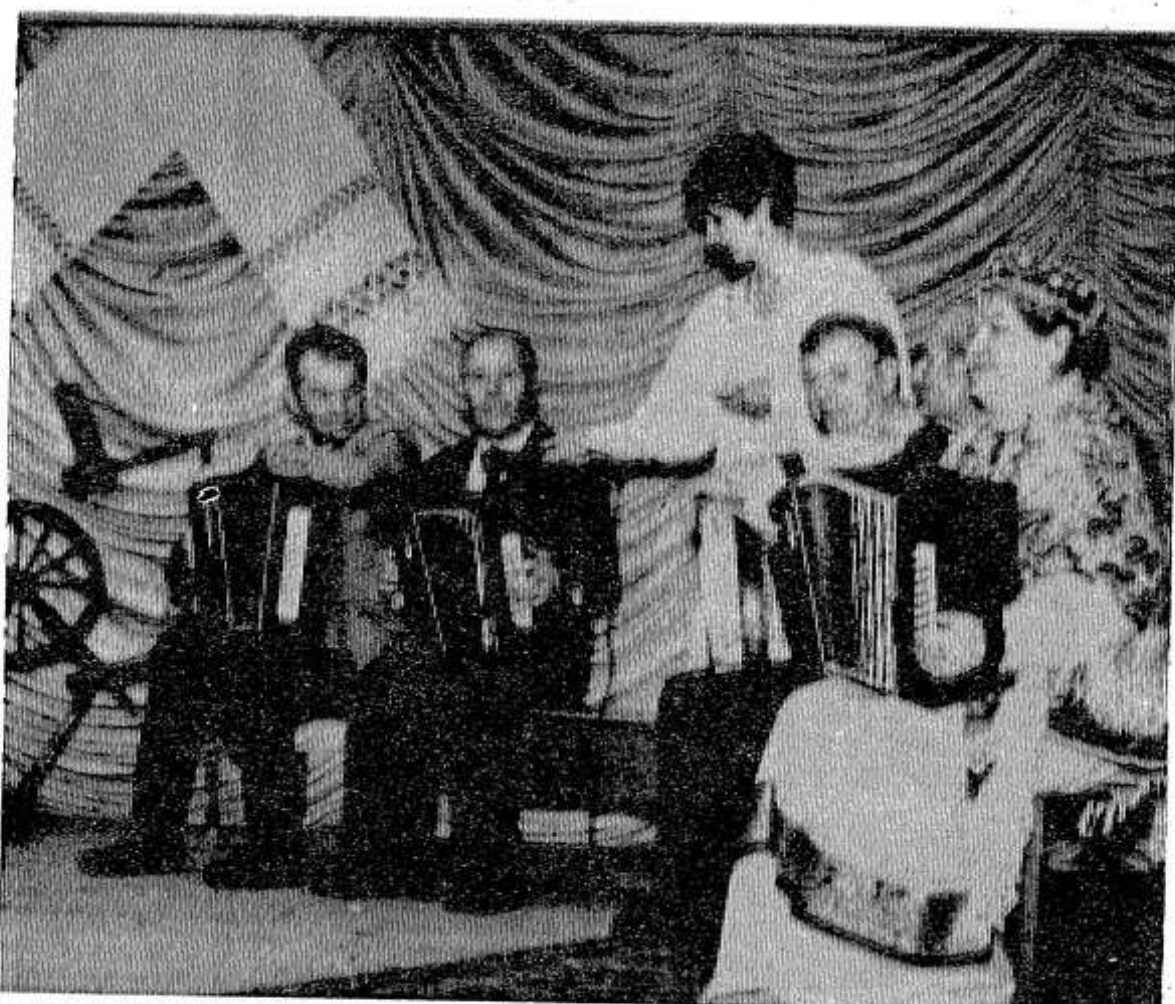
ревни Большие Рогатки.