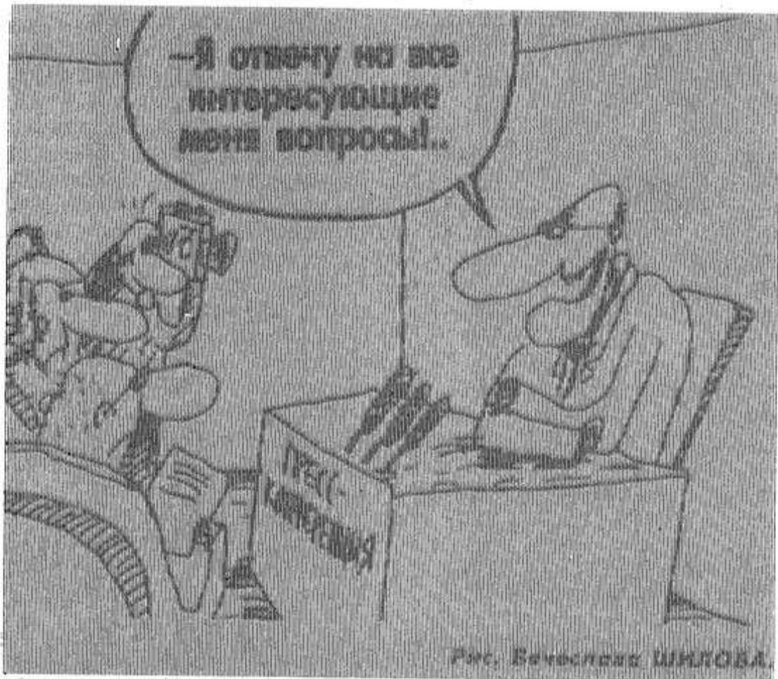
Рис. В. В. БИЧУКОВА

Правительство РФ издало три постановления, направленные на помощь селу: «О мерах по ускорению обеспечения сельскохозяйственных товаропроизводителей средствами химизации в 1999 году», «О мерах по обеспечению горюче-смазочными материалами сельскохозяйственных товаропроизводителей для проведения весенне-полевых работ в 1999 году», «О лизинге машиностроительной продукции в агропромышленном комплексе РФ с использованием средств федерального бюджета».