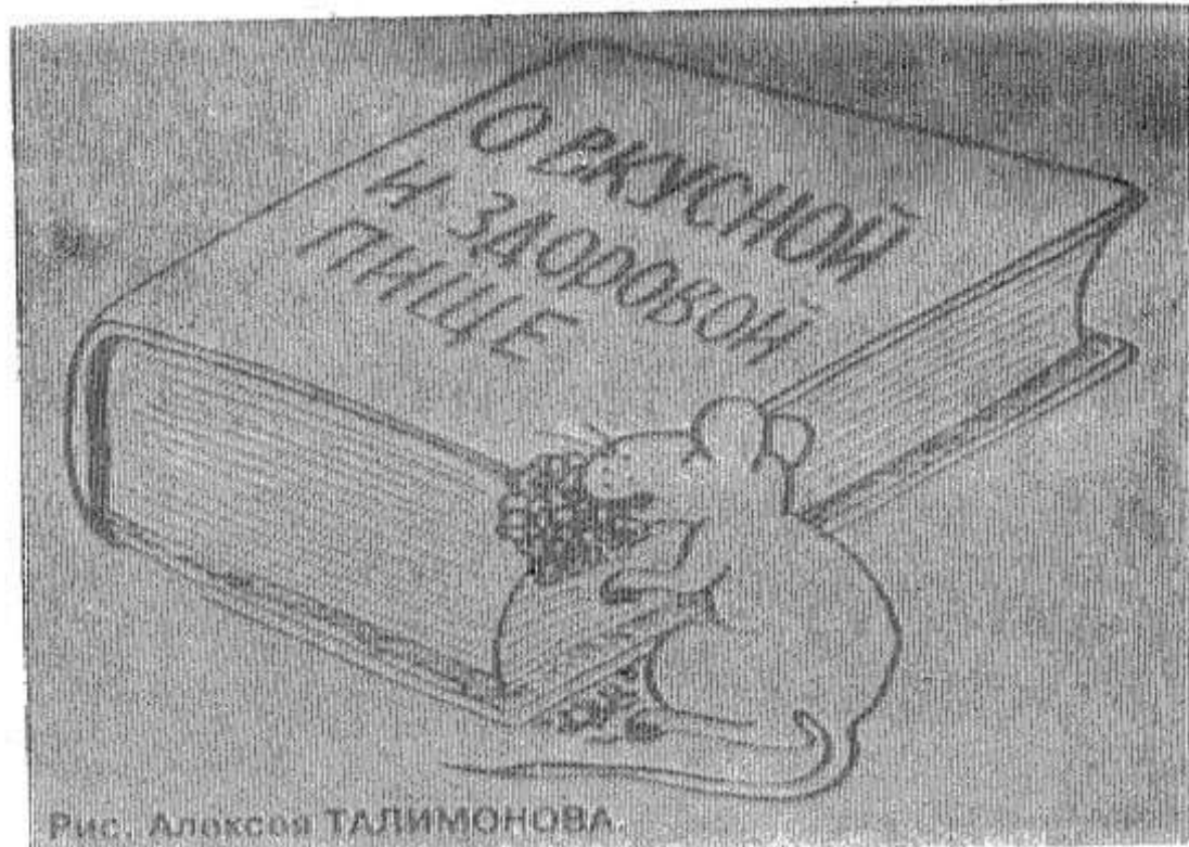
Рис. Алевксая ТАЛИМОНОВА