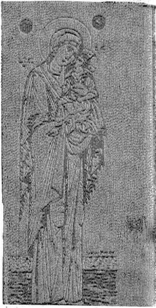
Икона Рождества Христова

ИСТОРИЯ сохранила некоторые обстоятельства пришествия в мир Начальника жизни Иисуса Христа. Святое Евангелие об этом событии повествует так: в те дни вышло от Римского царя Августа повеление сделать перепись по всей земле. И пошли все записываться, каждый в свой город. Пошел также и Иосиф из города Назарета с Мариею в Иудею, в город Давидов, называемый Вифлеем. Когда они там были, наступило время родить Ей. И родила Сына Своего Первенца, и положила в ясли, потому что не было им места в гостинице.