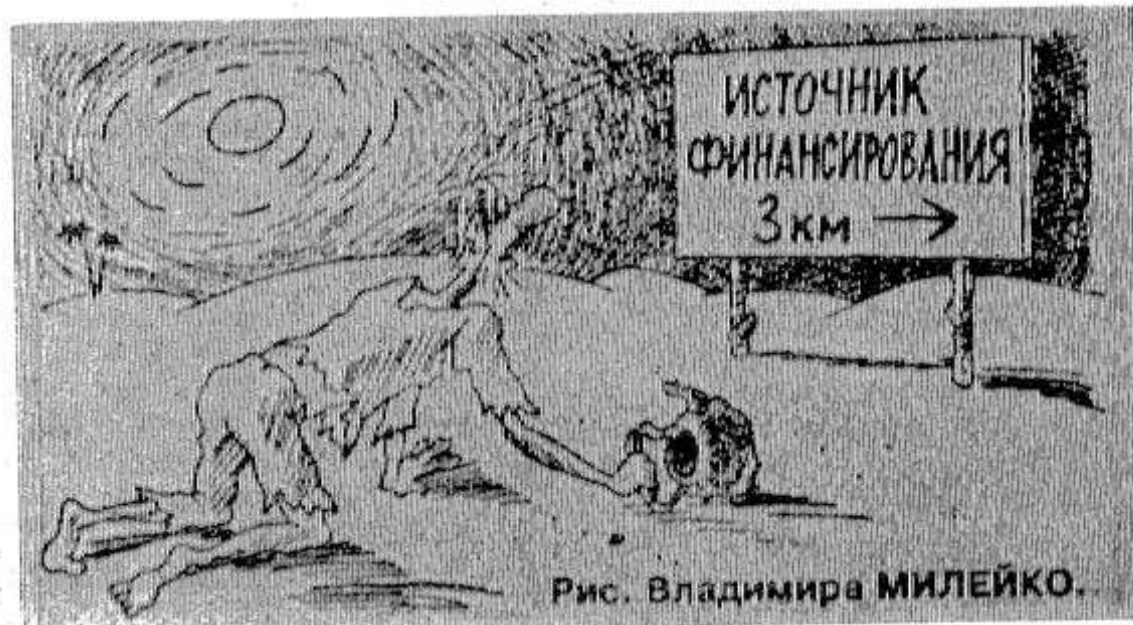
Рис. Владимира МИЛЕЙКО.

А. Лебедь в интервью газете «Вашингтон пост» заявил, что будет участвовать в президентских выборах, если поймет, что нужен и если будет иметь для этого средства.