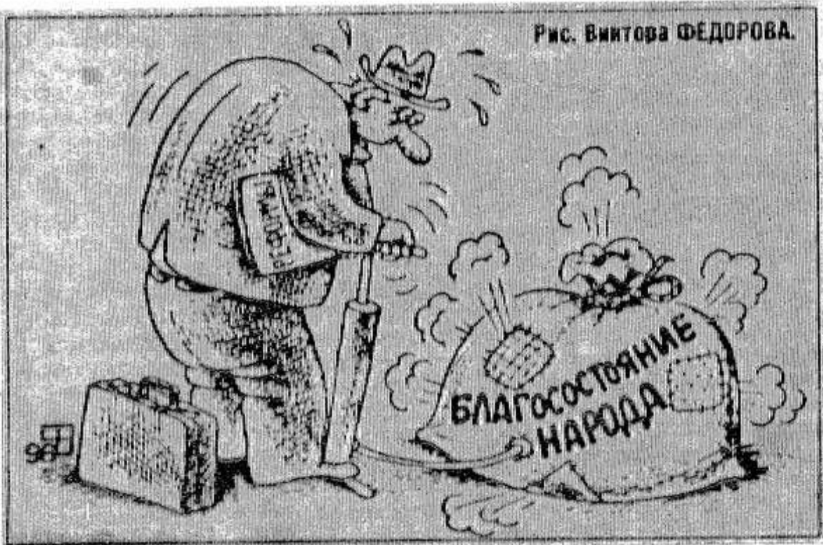
Рис. Витора ФЕДОРОВА.

Миссия Международного валютного фонда пока не поддержала предложенный российским Министерством финансов проект бюджета России на 1999 год. Позиции МВФ и правительства РФ расходятся в вопросах налоговой политики и роли государства в поддержке отечественных товаропроизводителей.