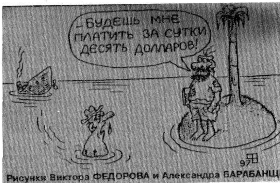
Рисунки Виктора ФЕДОРОВА и Александра БАРАБАНЦА

Завершается уборка хлебов на Кубани: урожайность озимой пшеницы — 33,2 центнера с гектара, что на 4 центнера меньше, чем в прошлом году. Поскольку и площадь над ней была меньше, то валовой сбор для Кубани невелик — около 2 млн. тонн.