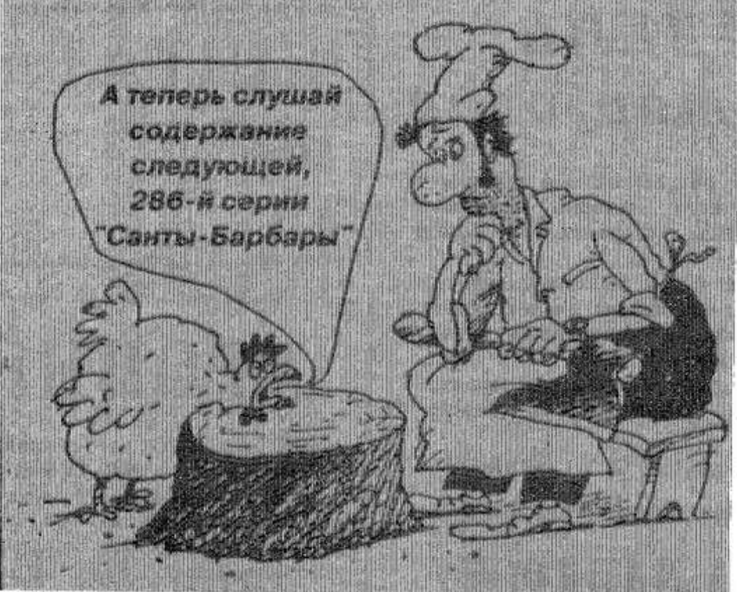
Рисунки Николая ВОРОНЦОВА.