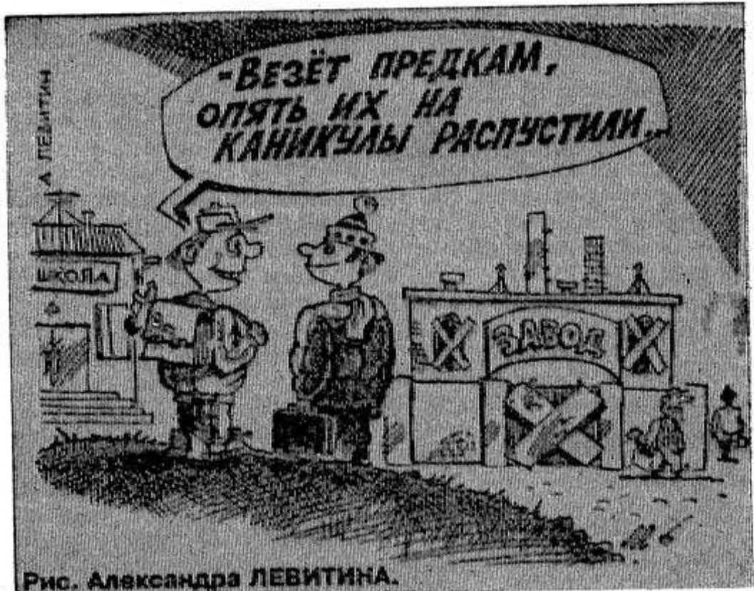
Рис. Александра ЛЕВИТИНА.

Подписан указ президента и постановление правительства о введении государственной монополии на ввоз табака.