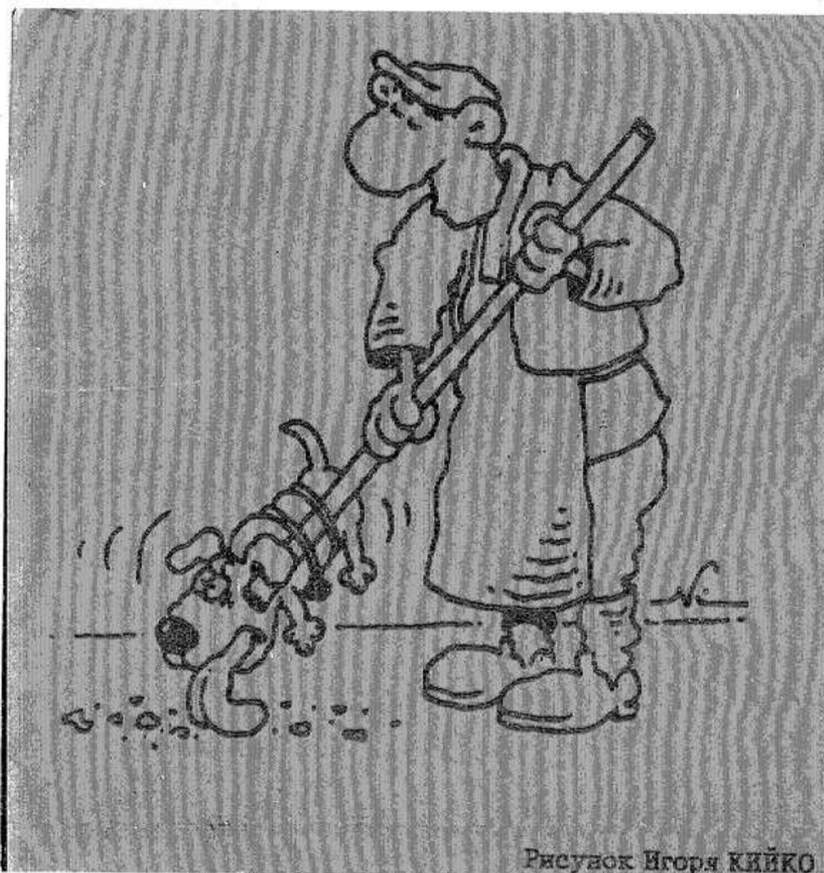
Рисунок Игоря КИЙКО