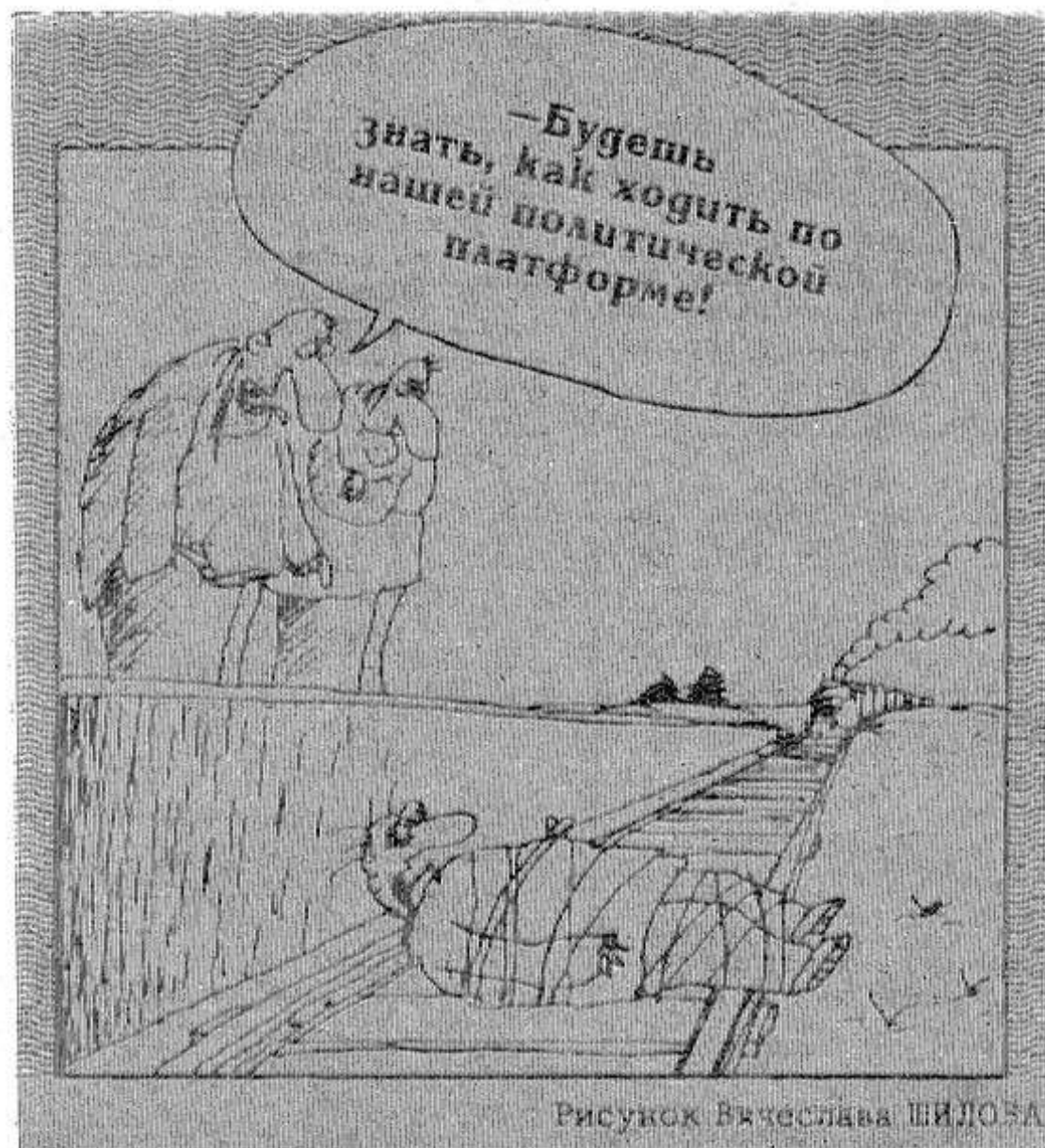
Рисунок Вячеслава ШИЛОВА