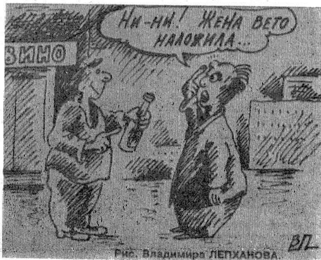
Рис. Владимира ЛЕПХАНОВА

Со следующей недели на втором канале Российского телевидения будет создана специальная рубрика, в рамках которой в прямом эфире В. Черномырдин будет еженедельно отвечать на поступающие вопросы телезрителей.