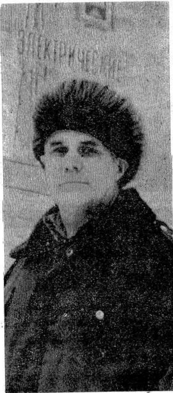
Сапер ошибается один раз. Это изречение можно отнести и к профессии электромонтера, которому почти ежедневно приходится иметь дело с оборудованием высокого напряжения.

В Макушинской школе десять гектаров земли, и это в буквальном смысле слова райский сад, и так и хочется сказать по аналогии: райский огород.