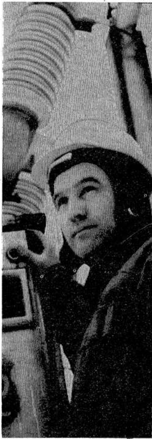
сударства не будет. За одиннадцать месяцев этого года выработано 18 млн.

В советское время потребление электроэнергии постоянно росло, а с началом перестройки начало ежегодно падать. Это связано с общим падением производства. Восстановление сетей и оборудования за последние десять лет сократилось в 20 раз. Сейчас идет только ремонт линий, причем новых проводов нет. Но основы, заложенные при Советской власти, дают возможность еще работать несколько лет, а потом нужно будет все менять. А массовая замена оборудования и сетей потребует огромных капиталовложений, которых, возможно, у го-