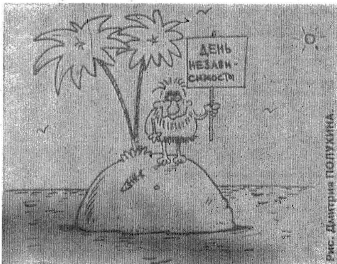
Рис. ДАНИИЛА ПОЛУХИНА

26 октября состоялись губернаторские выборы в Орловской области. Победу одержал Егор Строев.