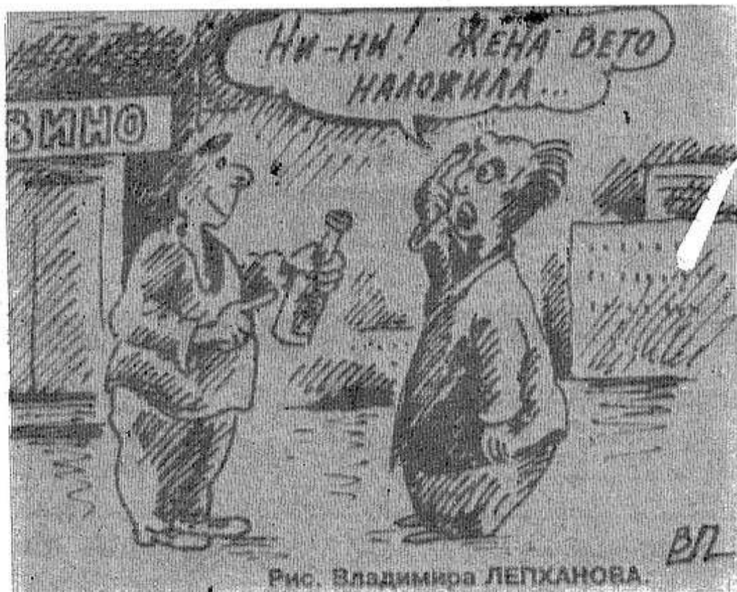
Рис. Владимира ЛЕПХАНОВА

У ВАЖАЕМАЯ редакция, вы поднимаете много интересных вопросов, связанных с нашей повседневной жизнью. И довольно злободневных.