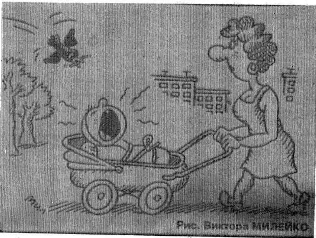
Рис. Виктора МИЛЮКОВА

АДМИНИСТРАЦИЯ, профсоюзный комитет Опочечского хлебокомбината поздравляют ветеранов труда, ранее работавших и работающих в настоящее время, с Днем пожилого человека. Желаем вам здоровья, благополучия, долгих лет жизни и согласия в семье.