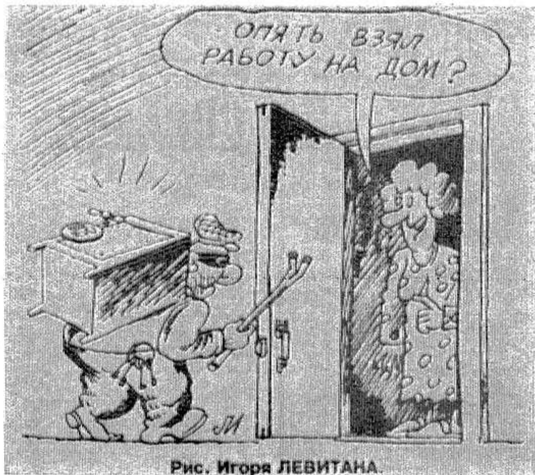
Рис. Игоря ЛЕВИТАНА