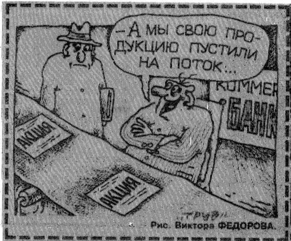
Рис. Виктора ФЕДОРОВА.

В ходе реформирования Вооруженных сил РФ численность сухопутных войск будет сокращена с нынешних 412 тыс. до 320 тыс. человек.