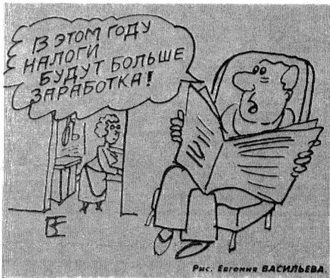
Рис. Евгения ВАСИЛЬЕВА.

Производство продукции сельского хозяйства России в первом полугодии нынешнего года сократилось на 5 процентов по сравнению с тем же периодом 1996 г. Мяса в живом весе произведено 3,1 млн. тонн, что на 10 процентов меньше, чем год назад, молока — 17,6 млн. тонн (на 4 процента меньше), яиц — 16,1 млрд. штук (на 2 процента меньше).