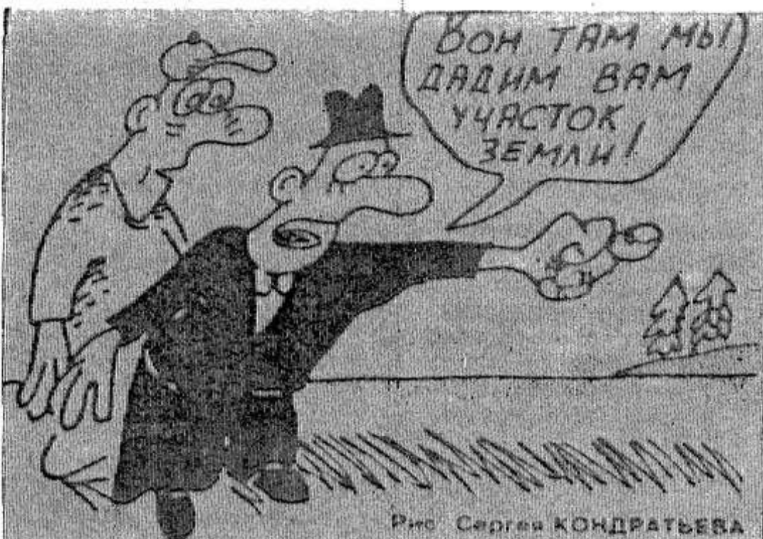
Рис. Сергея КОНДРАТЬЕВА

Препон много испытали и новые образования — кре-