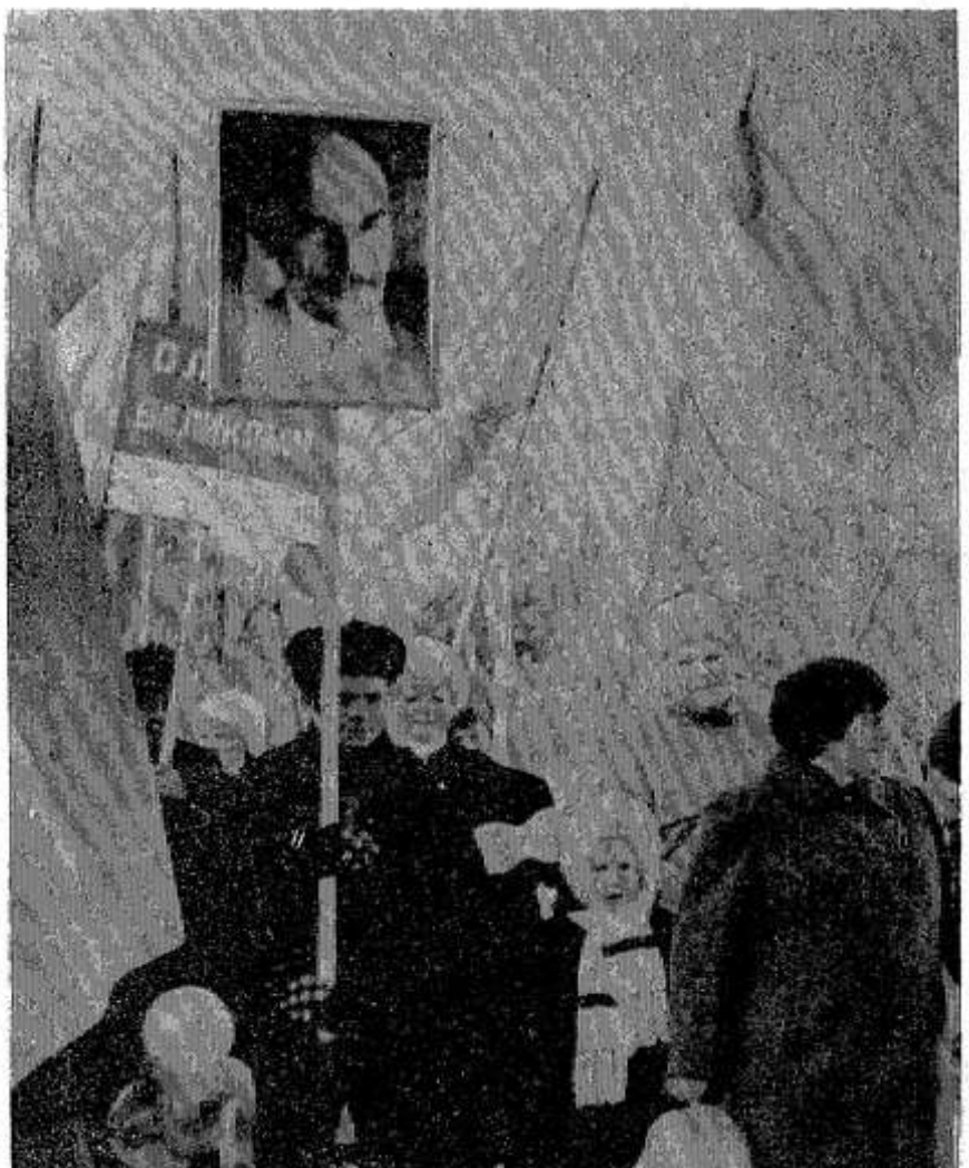
Так опочане праздновали Первомай в 80-е годы. О том, как относятся сегодня профсоюзные лидеры к этому празднику, читайте на 2-й странице газеты.

На планерке у главы района также шел разговор об организации первомайских праздников, в том числе и Дня Победы, о наведении порядка в городе.