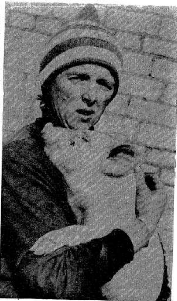
и все были оставлены на племя.

Свиноматки крупной белой породы, рождаемость в среднем 12 поросят, выживаемость тоже довольно высокая — 8 поросят. Рекордный опорос был 18 поросят. За ними был установлен специальный уход, все они выжили