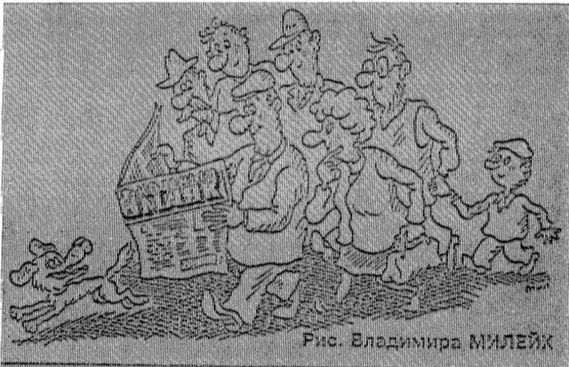
Рис. Владимира Милейк

Численность воздушно-десантных войск России с первого сентября будет сокращена до 34 тысяч военнослужащих. Сегодня в ВДВ насчитывается 46 тысяч десантников.