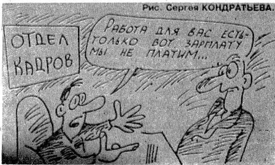
Рис. Сергея КОНДРАТЬЕВА.

Патриарх Московский и Всея Руси Алексей II осмотрел и одобрил строительство храма Христа Спасителя. Именно здесь Алексей II отслужит праздничную Пасхальную Великую Вечерню 27 апреля.