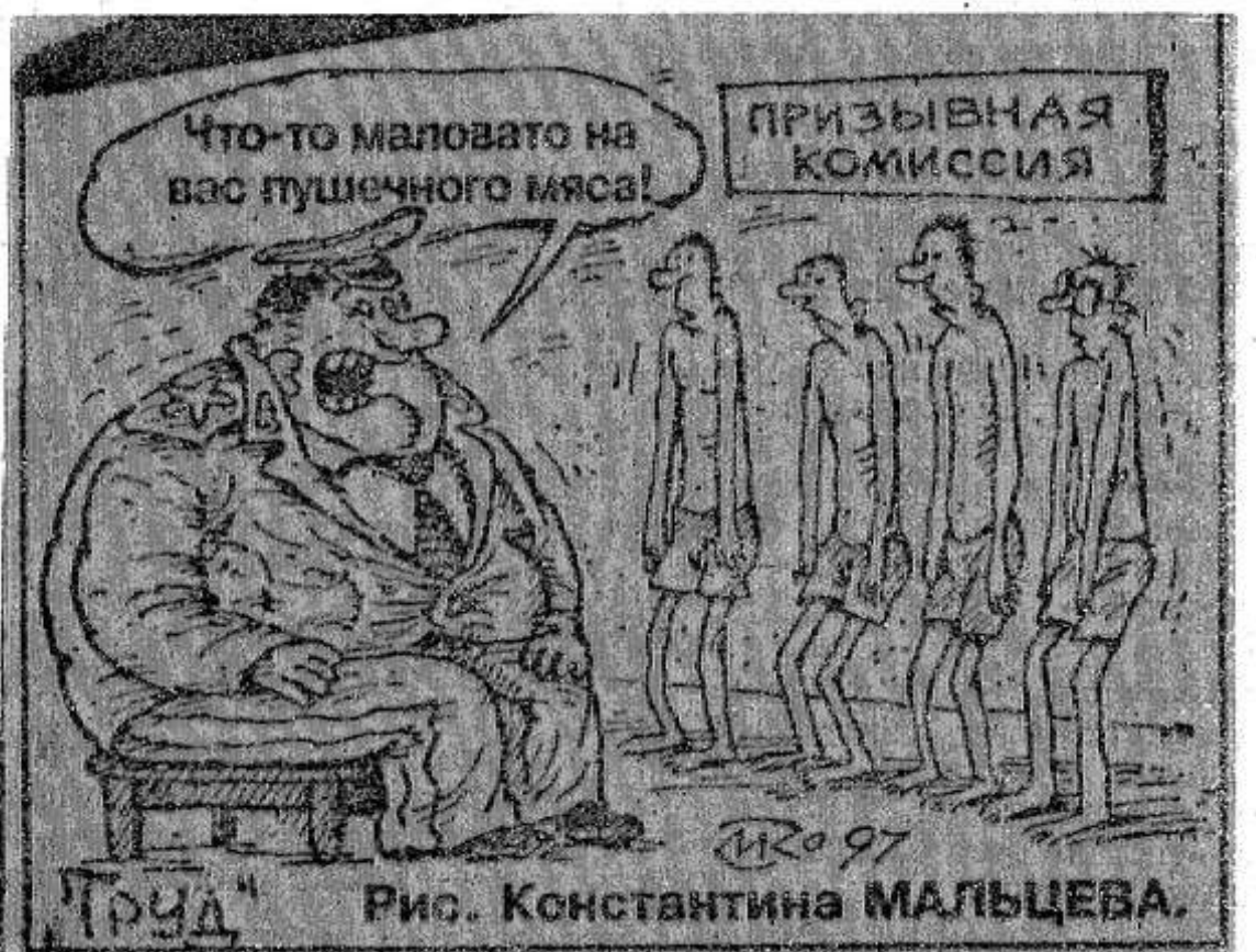
Рис. Константина МАЛЬЦЕВА.

(Чтобы прочесть обращение, надо накапать на это место теплого молока).