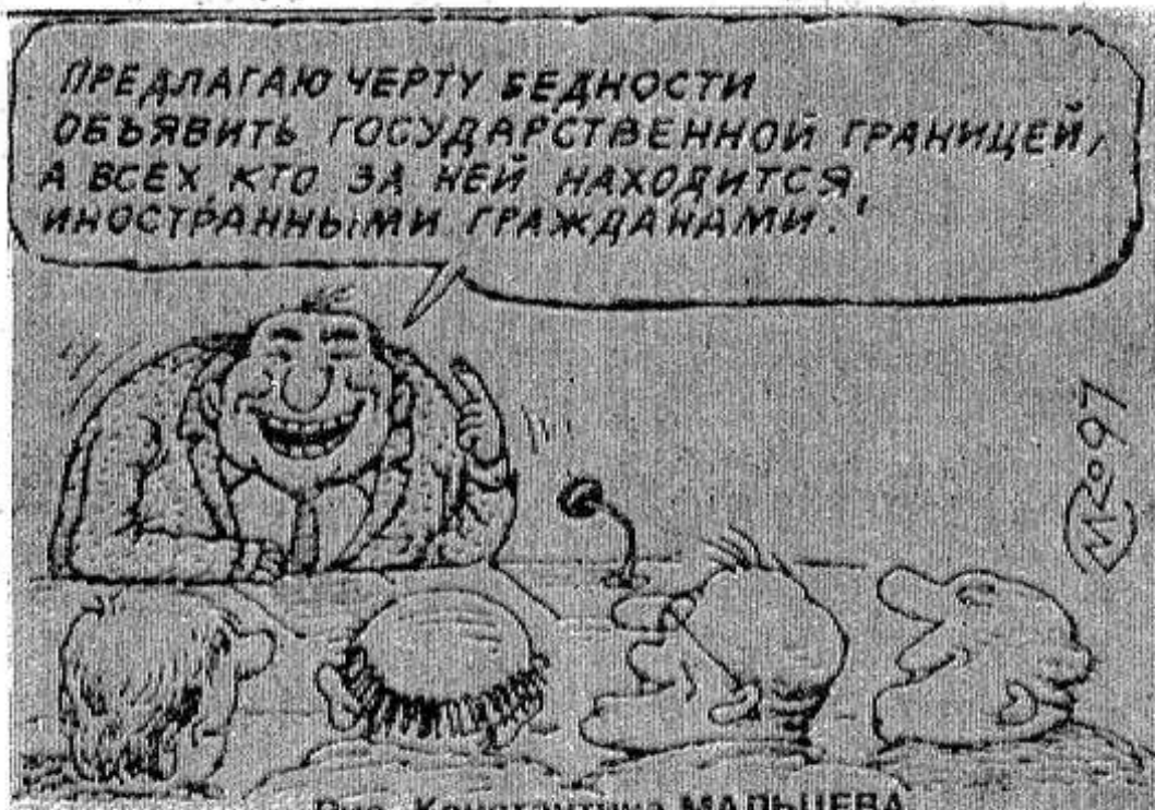
Рис. Константина МАЛЬЦЕВА