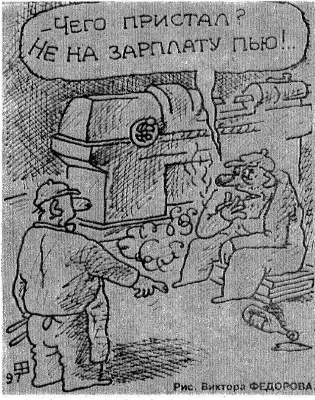
Рис. Виктора ФЕДОРОВА

Новый российский заграничный паспорт останется «краснокожим». Его описание утвердило правительство. Одна из особенностей документа — его соответствие международным стандартам. Он будет пригоден для считывания данных компьютером.