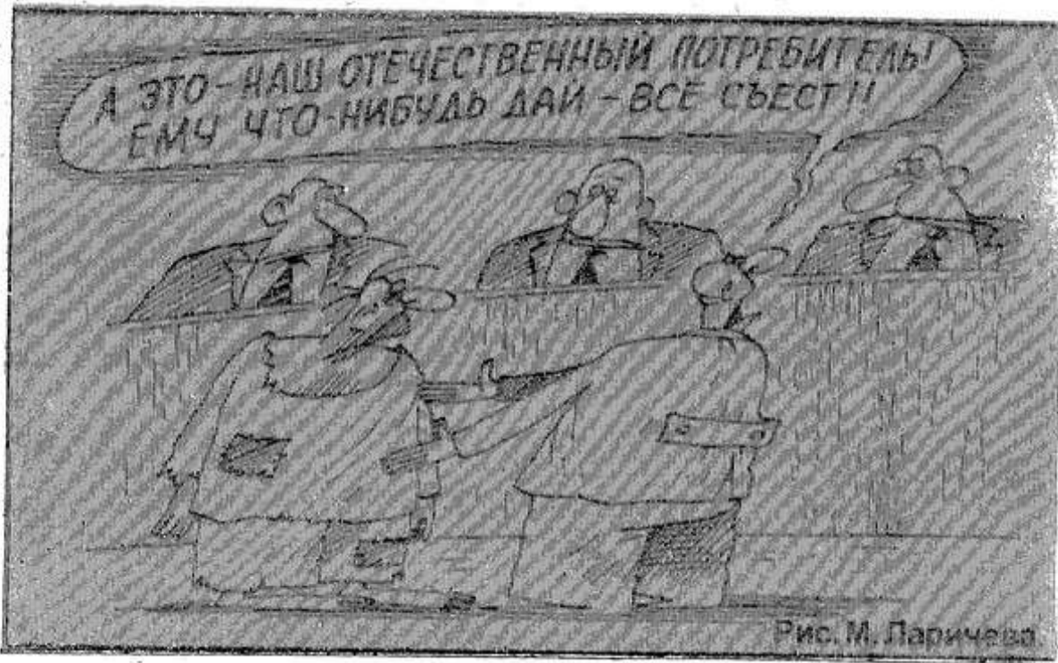
Рис. М. Паричев

Тамбовская милиция задержала группу азербайджанцев, пытавшихся сбыть несколько миллионов поддельных стотысячных купюр.