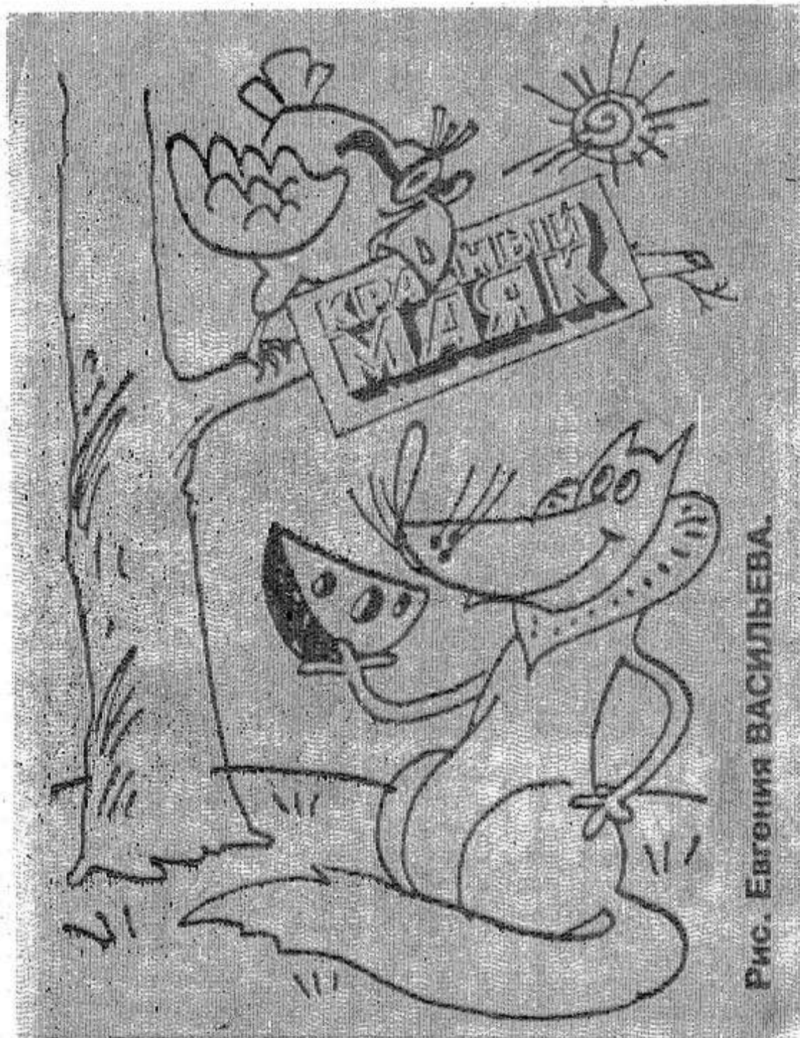
Рис. Евгения ВАСИЛЬЕВА.

4 декабря группой неизвестных в Грозном захвачена автомашина «УАЗ» с пятью офицерами федеральных сил и водителем. В ответ на обстрелы огонь федеральными силами не открывался.