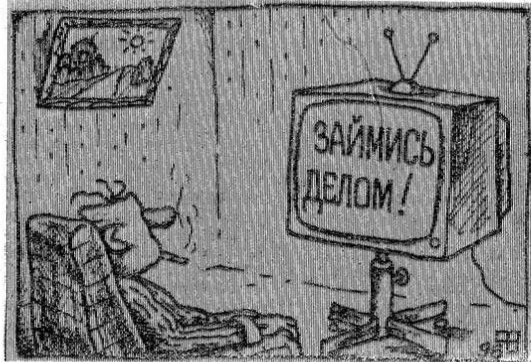
Рис. В. Фёдорова.

В результате катастрофы самолета ИЛ-76, произошедшей недалеко от аэропорта Абакан, погибли 23 человека. Самолет врезался в склон горы на берегу Енисея. Самолет имел на борту 30 тонн груза для жителей дальнего восточного региона.