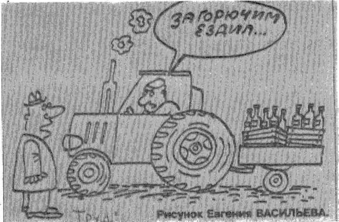
Рисунок Евгения БАСИЛЬЕВА.

Однако этого не скажешь о «Авангарде». Здесь себе позволяют не работать даже хорошие солнечные дни. Лучшее положение в «Опочецком», где на корню на отведенную дату оставалось 70 гектаров этой культуры. Некоторые руководители привлекли к работе со льном не только полеводов, пенсионеров, но и шефские организации города.