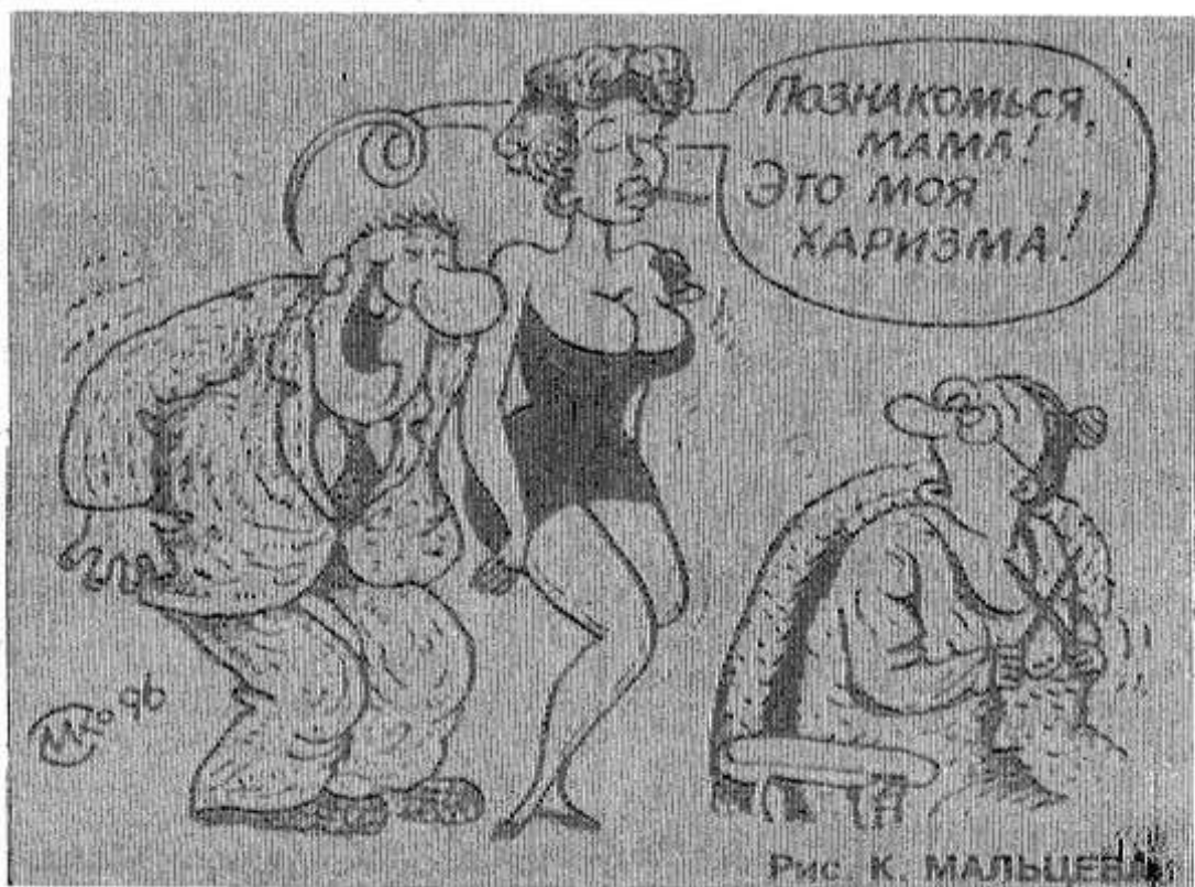
Рис. К. МАЛЬЦЕВА