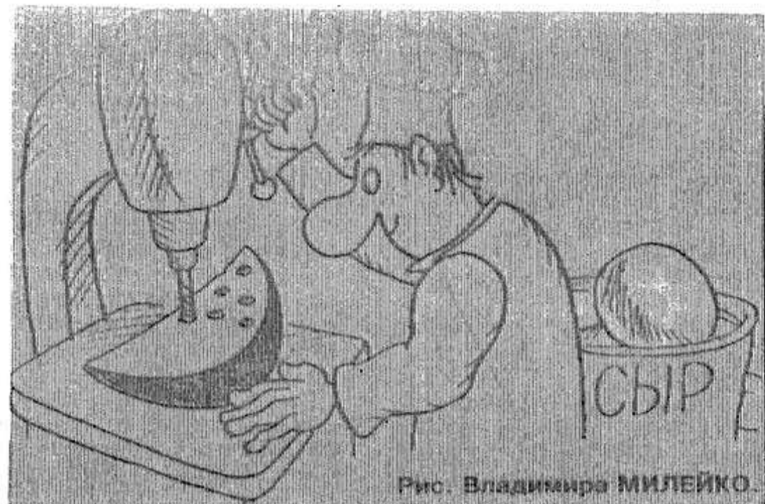
Рис. Владимира МИЛЕЙКО

Следует заметить, что закуп молока оживился и даст возможность частнику надеяться, что к осени он не поведет свою корову на забой.