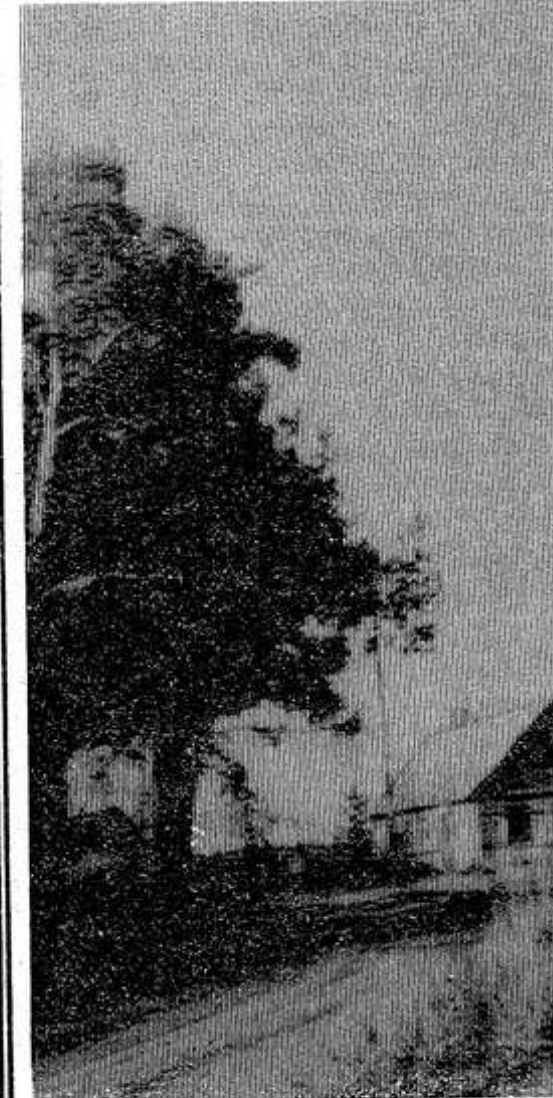
Родные края.