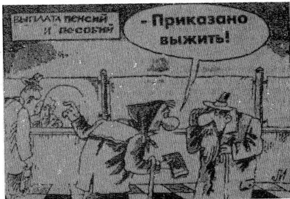
Рис. из «Российской газеты».