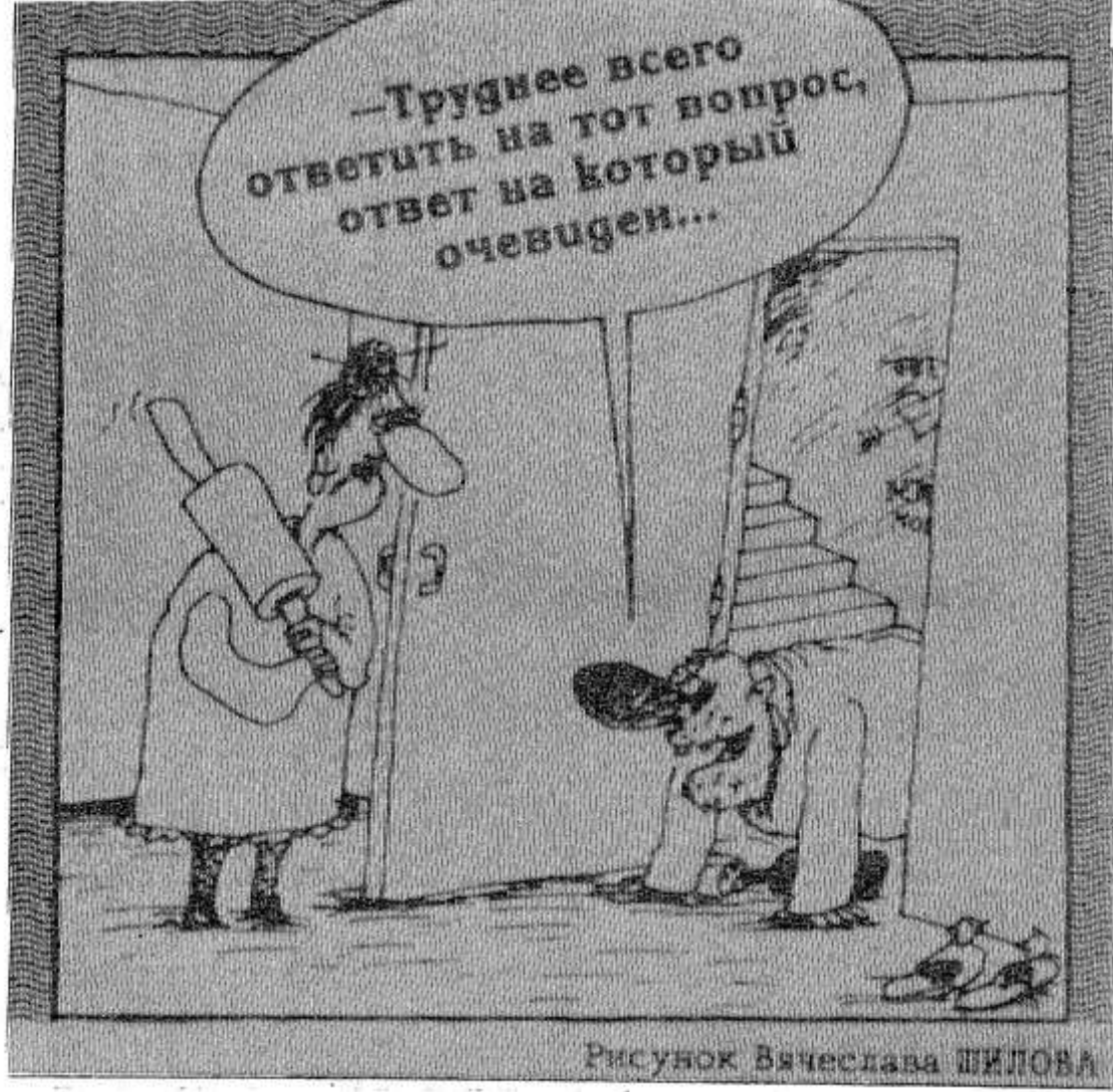
Рисунок Вячеслава ШИЛОВА