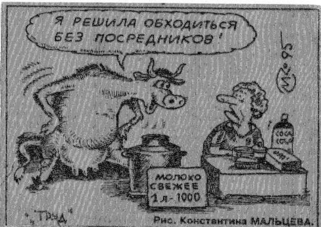
Рис. КОНСТАНТИНА МАЛЫЦЕВА.

Приходится бывать в торговых точках кооперативов, товариществ аграриев. Но их так мало. А ведь сравнительно дешевое мясо, произведенное ими, уходит оптовикам в большие города. Почему бы нашим властям серьезно не побеспокоиться о выделении помещений для