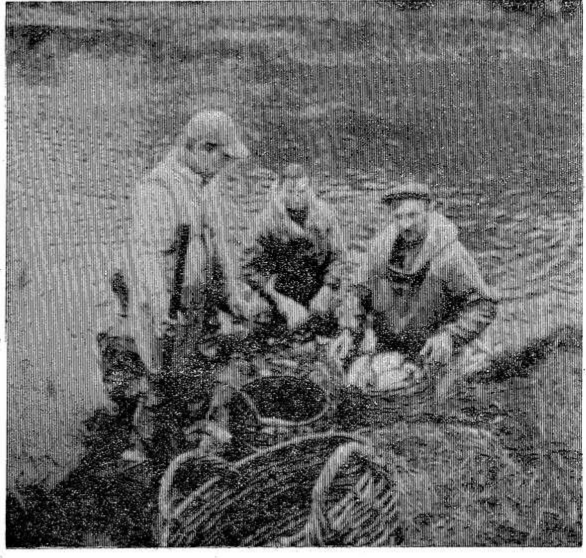
будет продано 46 тонн.