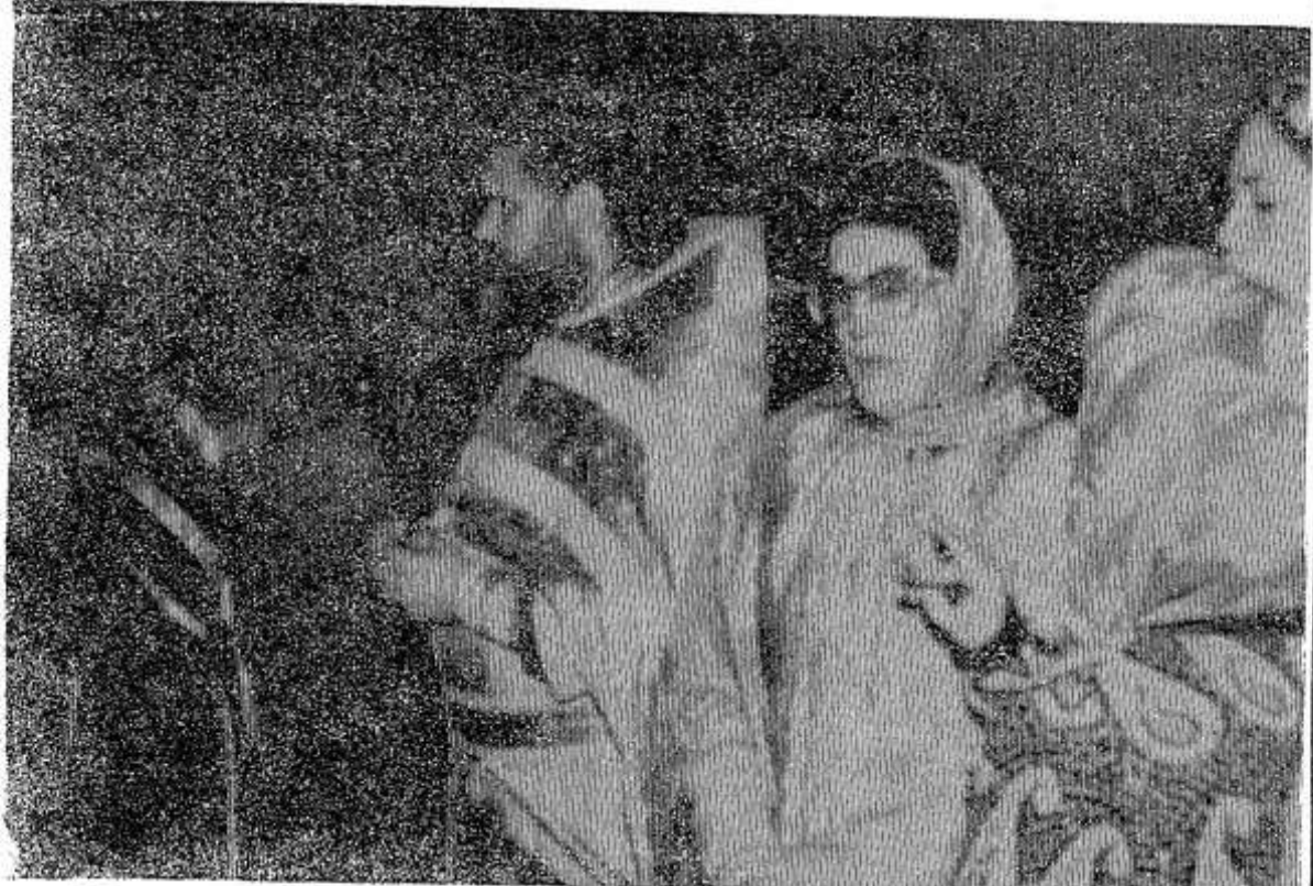
Многолюдным было богослужение в Терebenской Воскресенской церкви в день 250-летия со дня рождения великого русского полководца М. И. Кутузова.

Но все же в моей душе остается печаль о несбывшейся мечте по восстановлению старинного храма. ПРЕСС-БЮРО.