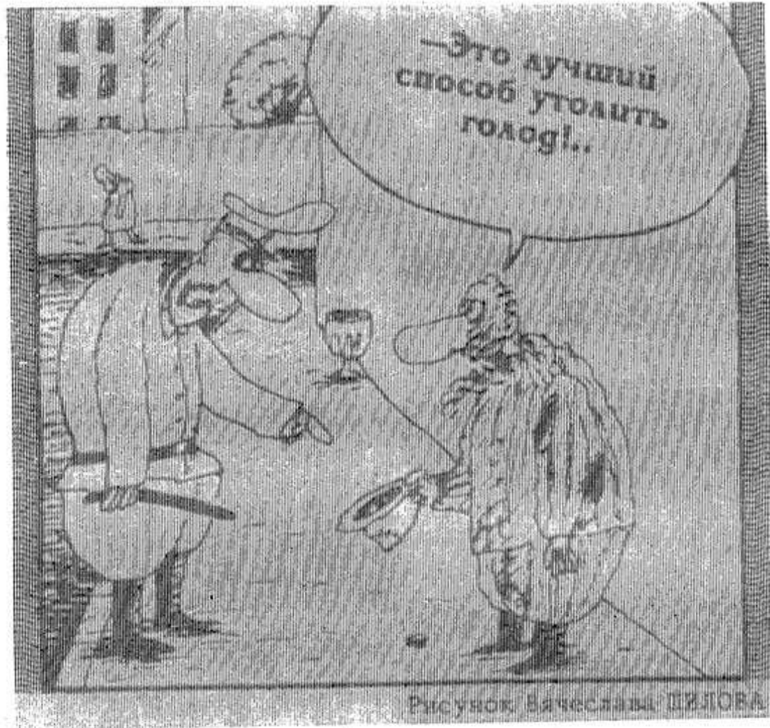
Рисунок Вячеслава ШИЛОВА

Роскошный гроб был помещен в пещерах — монастырской усыпальнице, где похоронены почитаемые православными людьми праведники. Захоронение здесь одного из руководителей преступной группировки вызвало возмущение населения и осуждение архимандрита Романа в церковных кругах. Духовное собрание старцев Псково-Печерского монастыря выбрало новым его настоятелем сорокалетнего монаха архимандрита Тихона.