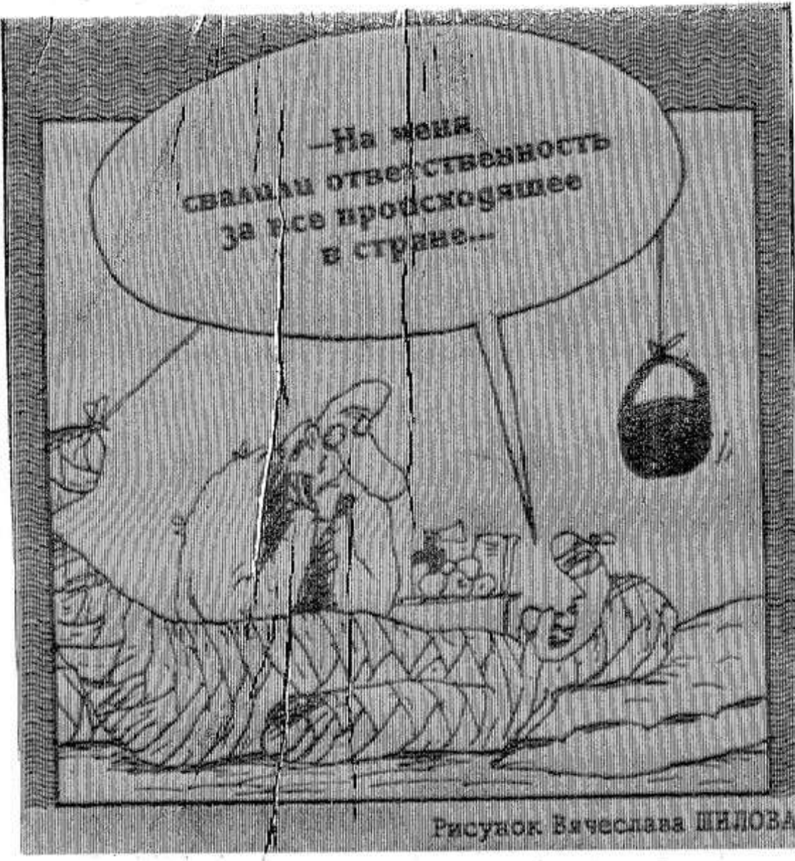
Рисунок Вячеслава ШЕЛОВА