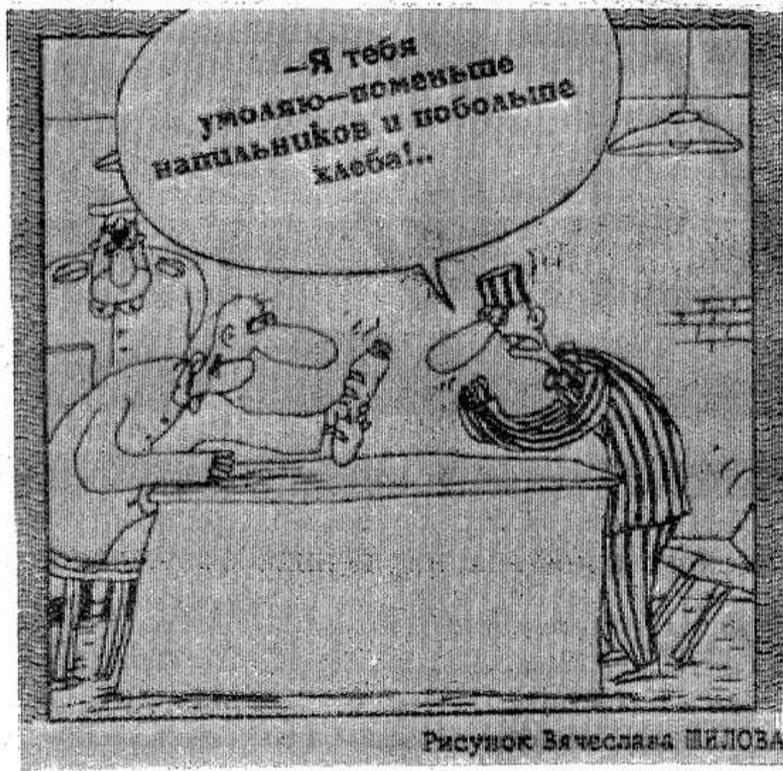
Рисунок Вячеслава ШИЛОВ

Подсчитав скорость утраты с годами ассиметрии, можно вывести формулу смерти для каждого.