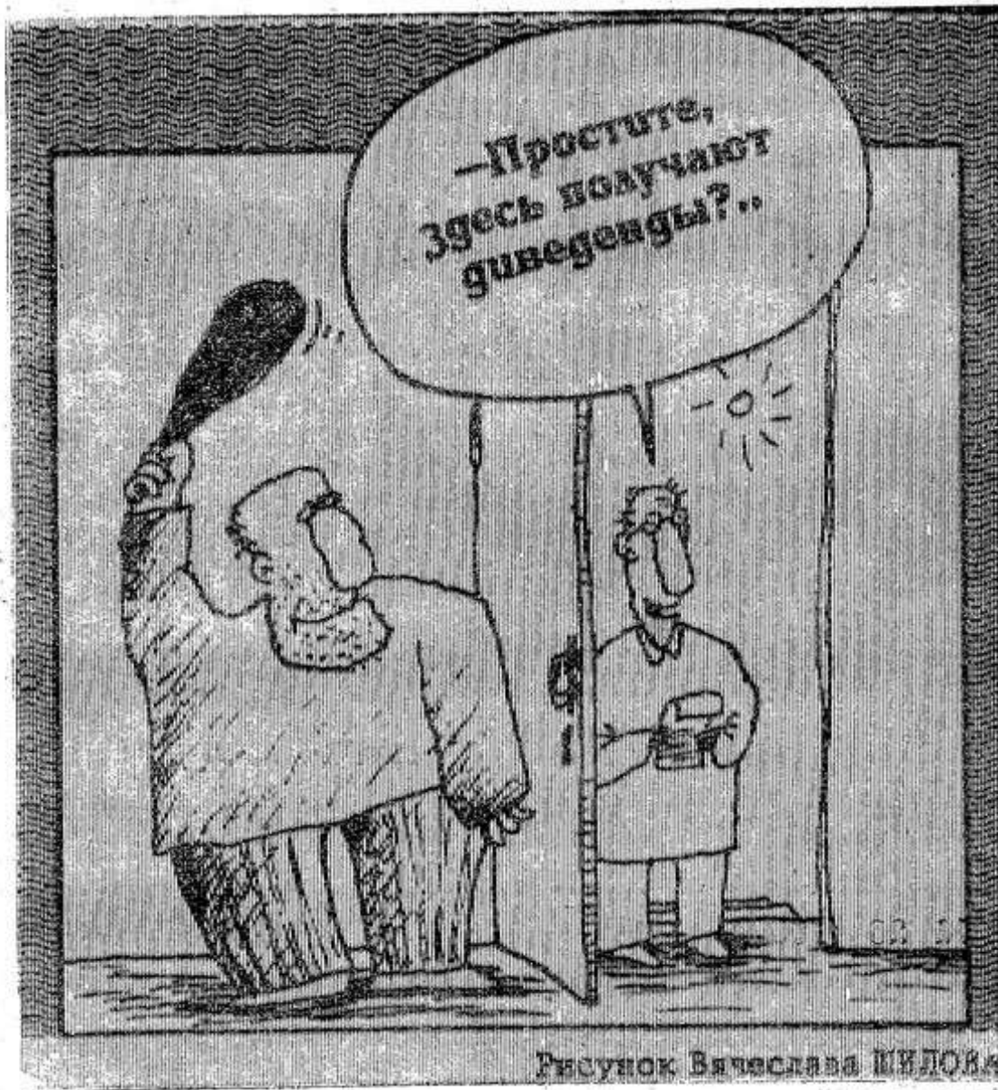
Рисунок Вячеслава МЕЛОВА

В 1994 году 154 преступника были приговорены судами к высшей мере наказания, но в 152 случаях расстрел был заменен отбыванием наказания в колонии или тюрьме.