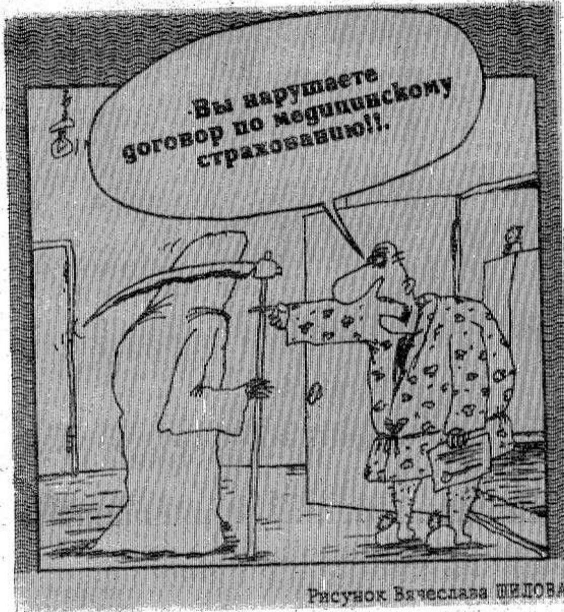
Рисунок Вячеслава ШЕЛОВА