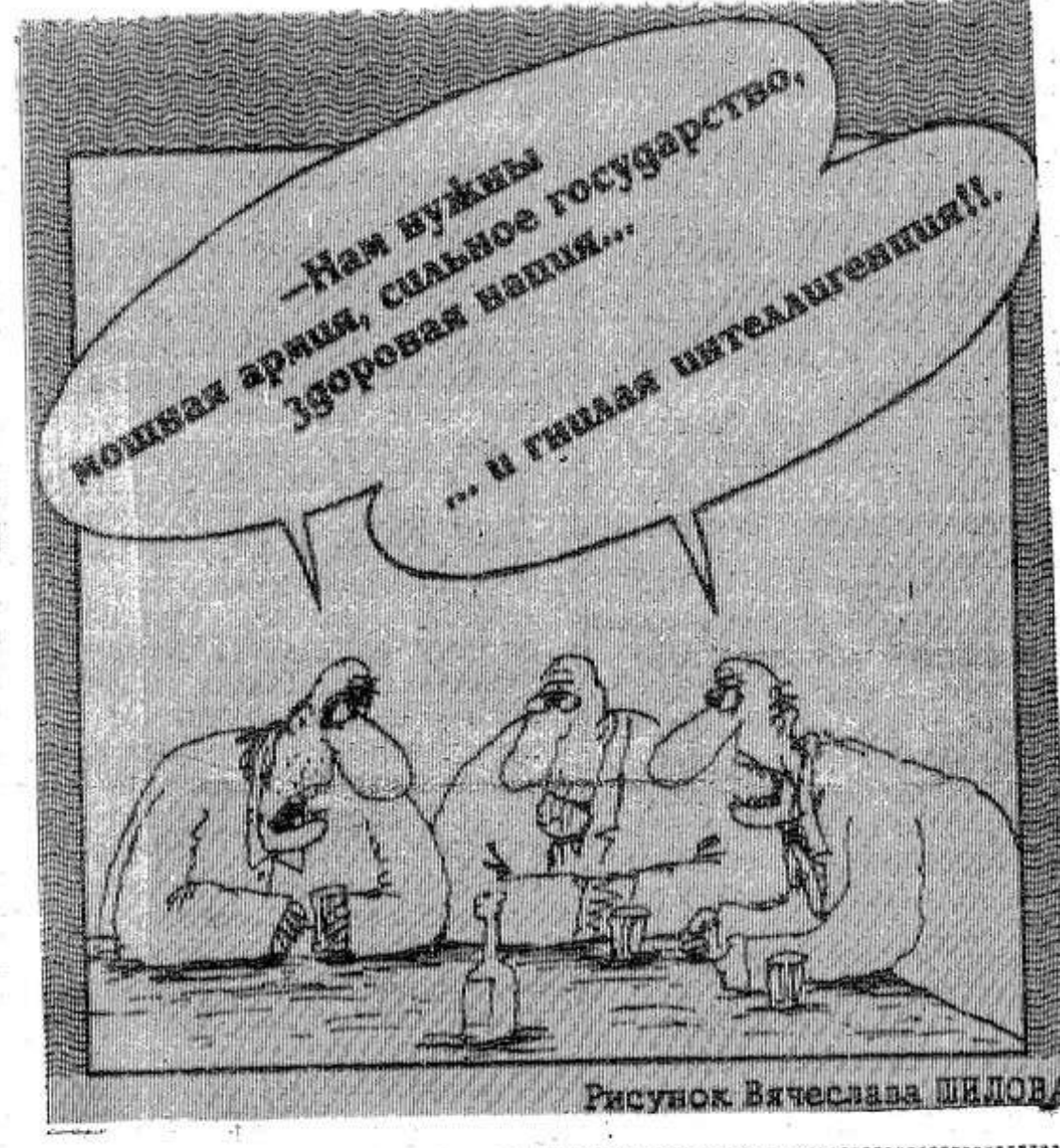
Рисунок Вячеслава ШЕЛОВА

В Воронежской области во время учебно-тренировочного полета с ракетометанием двух СУ-25 произошло ЧП. Одна из ракет, миновав полигон, взорвалась в 200 метрах от села Архангельское Хохольского района, вырыв огромный котлован. Ранен один человек, разрушено около двадцати домов. Ракета не долетела всего 4 км до Нововоронежской атомной электростанции. Причиной происшествия военные считают «издержки техники».